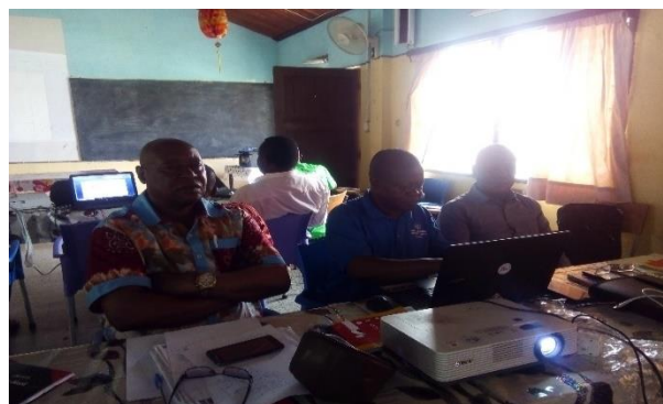
EQUIPE INSPECTION ENSEIGNEMENT ET SS. IGS