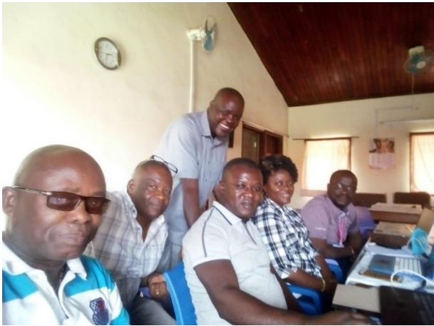
EQUIPE INSPECTION MEDICO TECHNIQUE IGS