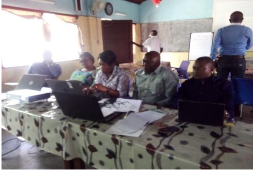
EQUIPE DE LA IPMP IGS